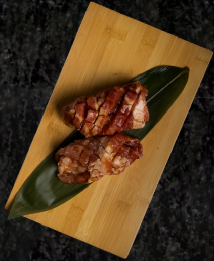
Korean Pork BBQ 돼지 양념구이