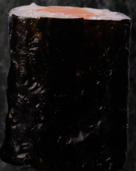
Sake Maki 연어