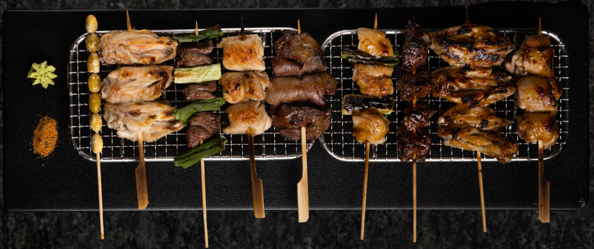
Modeum Kushi 모듬 꼬치