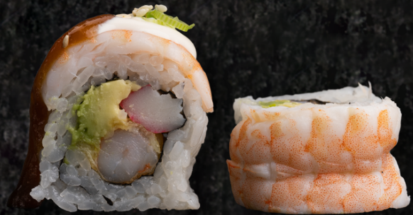
New Ebi Roll 뉴 에비 롤