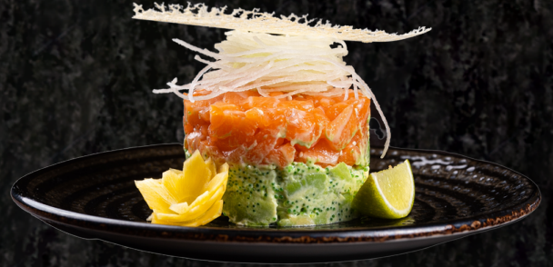
Tuna Tartar 참치 타르타르