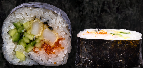
Ika Maki 오징어 마끼