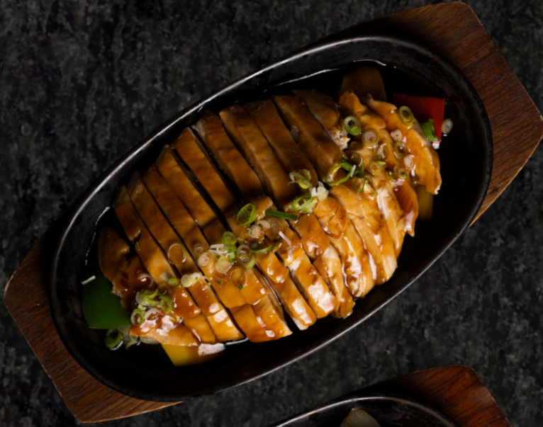
Chicken Teriyaki 치킨 데리야끼