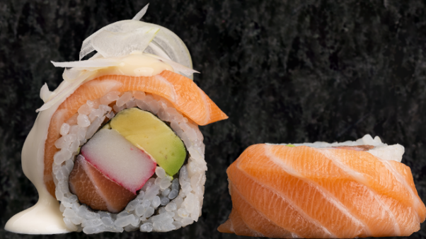
Alaska Roll 알래스카 롤