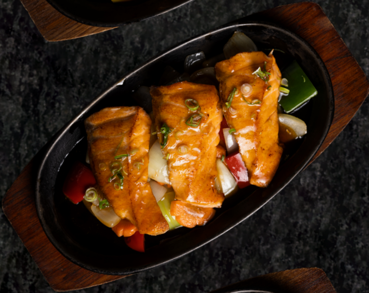
Salmon Teriyaki 연어 데리야끼