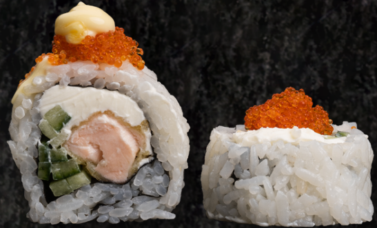
Philadelphia Cheese Roll 필라델피아 롤