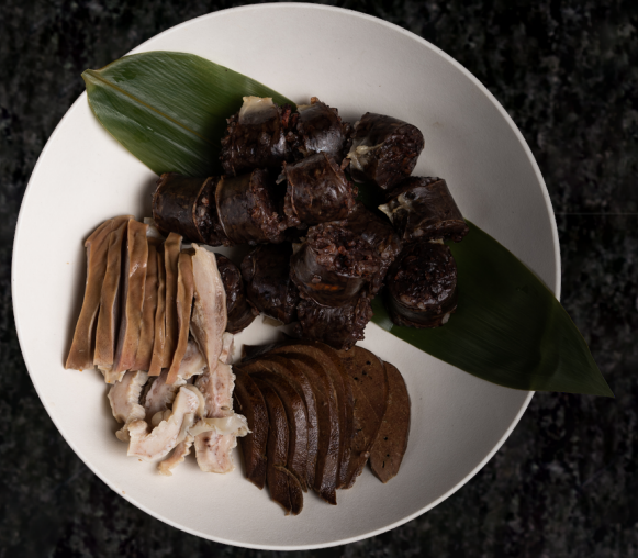
Modeum Sundae 모듬 순대