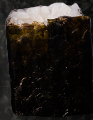
Ibodai Maki 참치