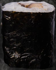
Shiitake Maki 표고버섯