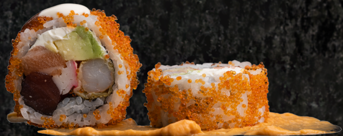
French Kiss Roll 프렌치 키스 롤