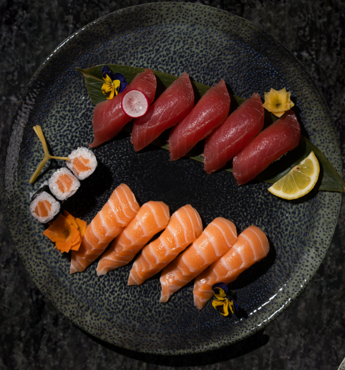
Sake+Maguro Sushi 연어+참치 초밥 세트