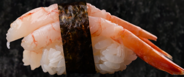
Ama Ebi 단새우