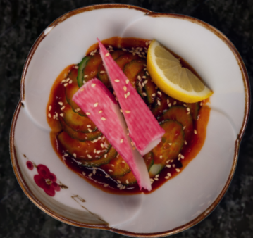
Spicy Wakame Salad 미역 초무침