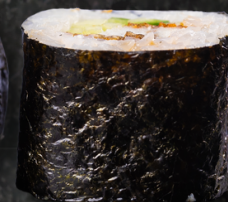
Unakappa Maki 장어+오이