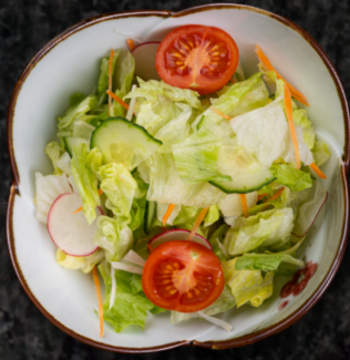
Hanil Salad 한일 샐러드