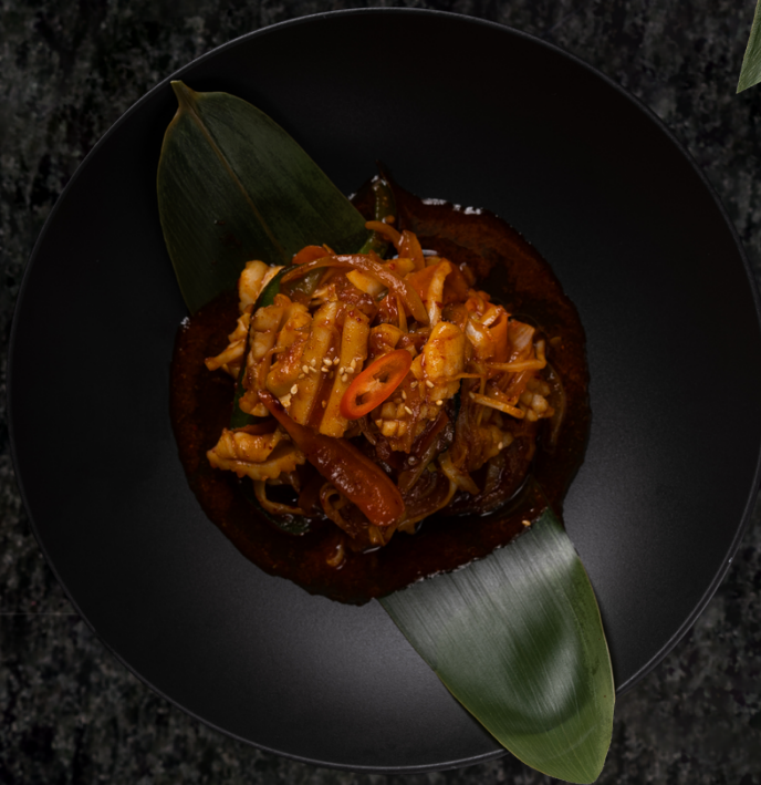
Odjingo Bokkeum 오징어 볶음