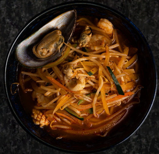
Haemul Jjampong 짬뽕