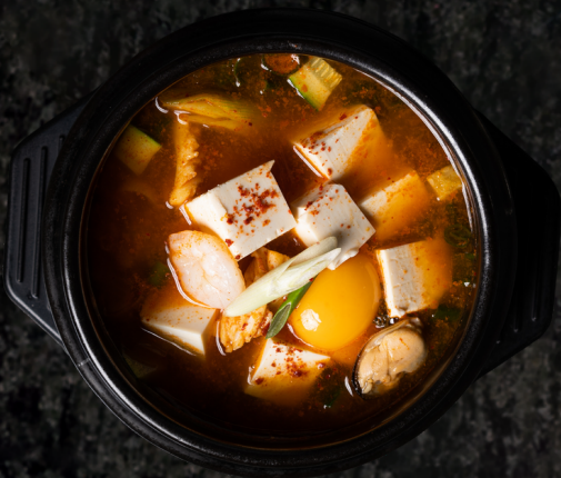
Seafood Tofu Soup 해물 순두부