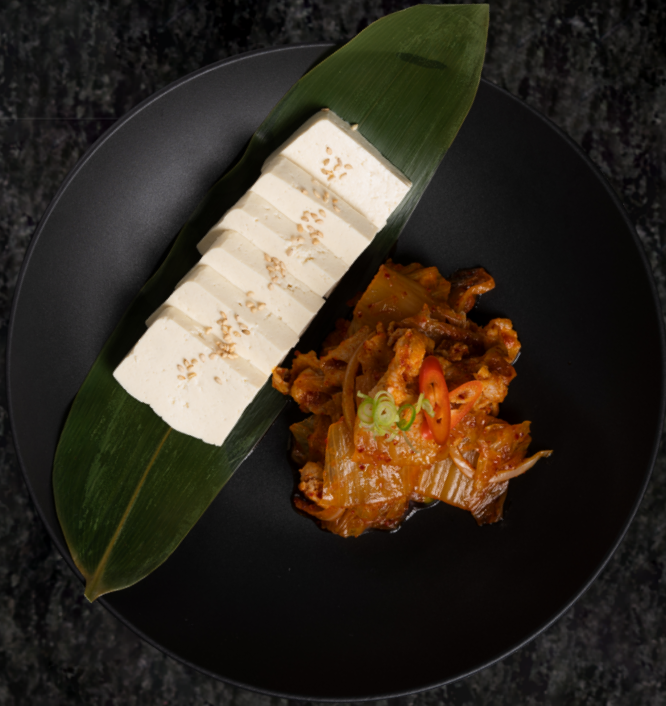
Kimchi Samgyobsal 김치삼겹살 볶음