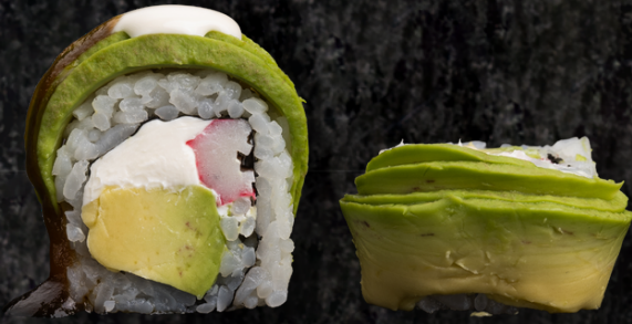
Green Roll 그린 롤