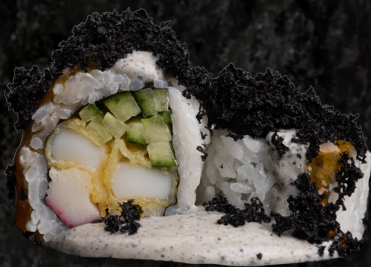
Black Roll 블랙 롤