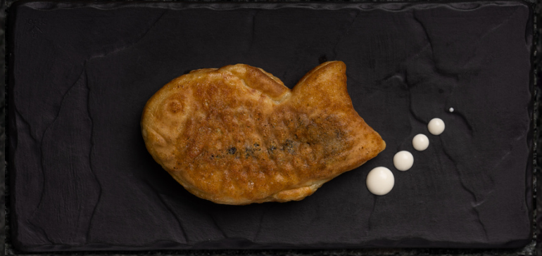
Taiyaki 1 pcs 붕어빵

Green tea / Black sesame / Lemon 녹차 / 흑임자 / 레몬샤벳