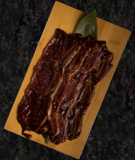
LA Galbi LA 갈비