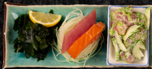
Sanpin Mori 모듬 초무침