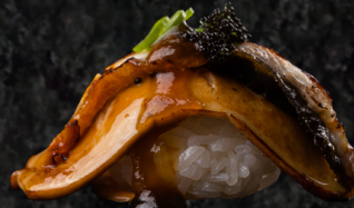
Foie-gras -Unagi 푸아그라-장어