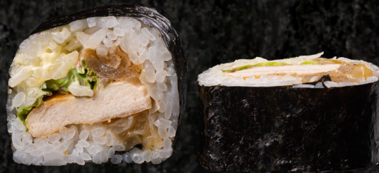
Chicken Mayo Maki 치킨+마요 마끼