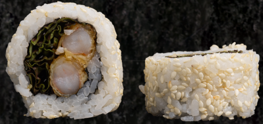
Tempura Roll 템푸라 롤