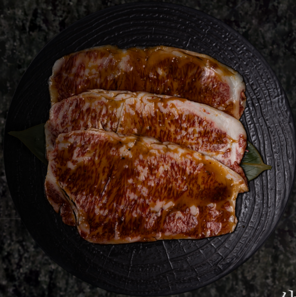
Wagyu Yakiniku 와규 야끼니꾸