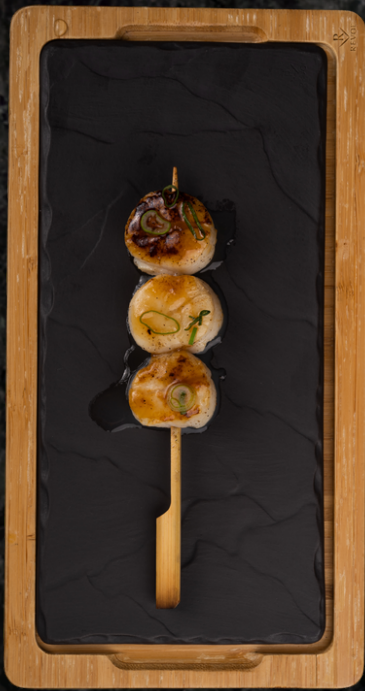
Hotate Kushi 관자 꼬치구이