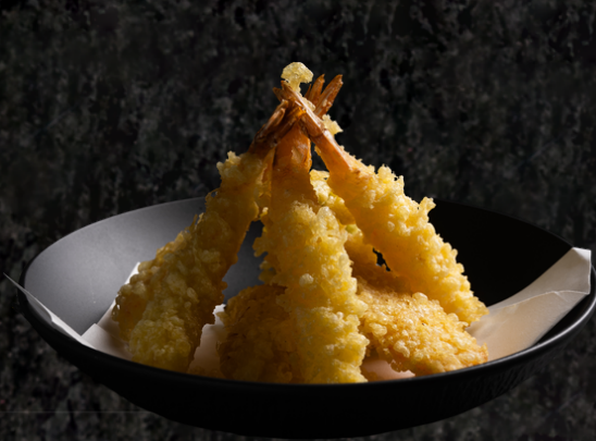
Ebi Tempura 새우튀김