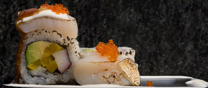
Scallop Roll 관자 롤