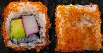
Cali Tobikko Roll 캘리포니아 토비코 롤