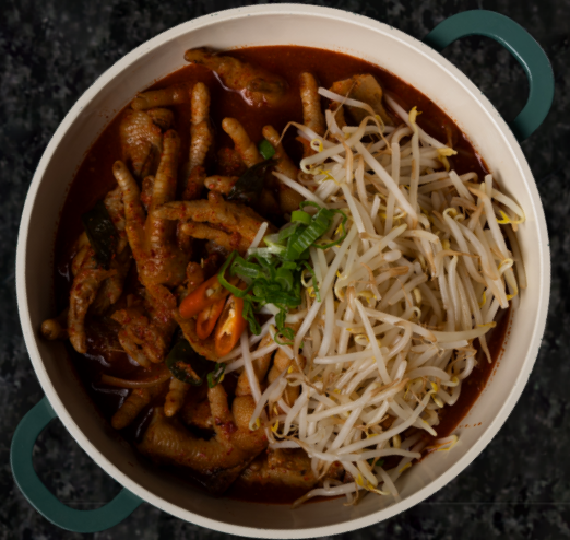
Han-sin Dakbal 한신 닭발