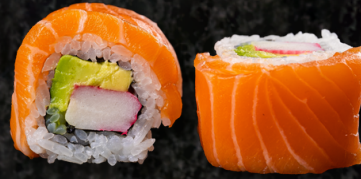
Sake Roll 연어 롤