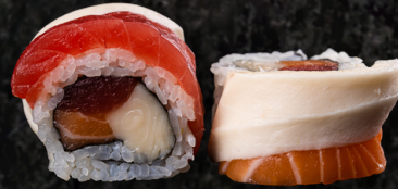
Mix Roll 믹스 롤