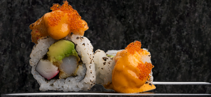
Volcano Roll 볼케이노 롤