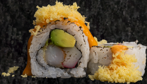
Dynamite Roll 다이나마이트 롤