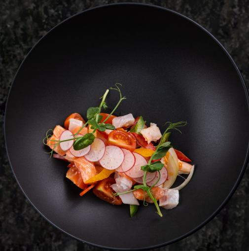
Hanil Ceviche 한일 세비체