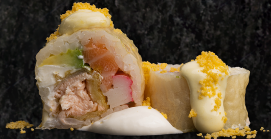
Venus Roll 비너스 롤