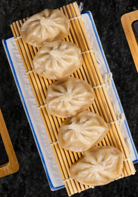
Mushi Gyoza 무시교자