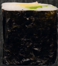
Avocado Maki 아보카도