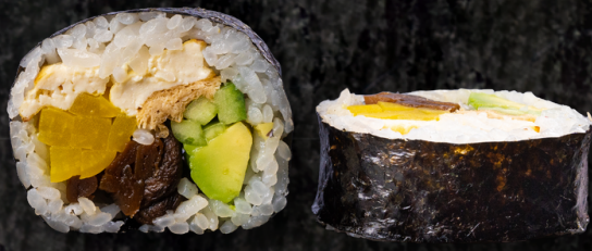
Vegetarian Maki 베지테리언 마끼