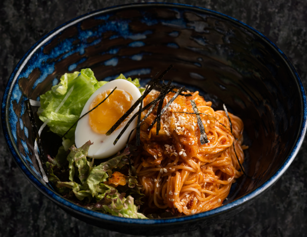
Bibim Guksu 비빔국수