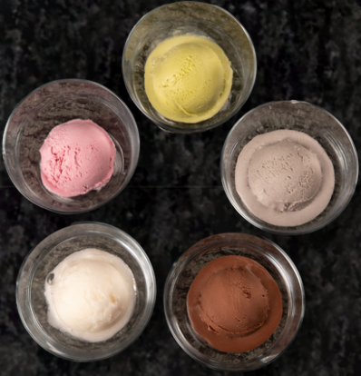
Ice cream 1 Scoop 아이스크림 1 스쿰

Vanilla / Strawberry / Chocolate 바닐라 / 딸기 / 초코