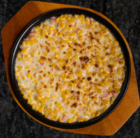
Corn Butter 콘 버터