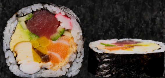
Giant Maki 자이언트 마끼