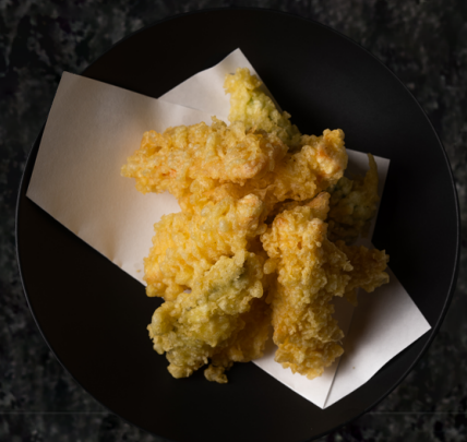
Salmon Tempura 연어튀김