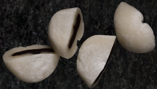
Mochi 3 pcs 모찌