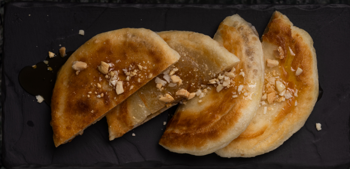
Hoddeok 2 pcs 호떡