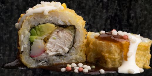
Moon Roll 문 롤