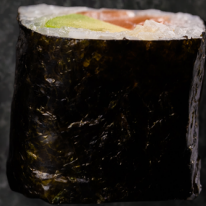
Avo-Sake Maki 아보카도 +연어