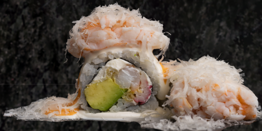
Saturn Roll 세턴 롤