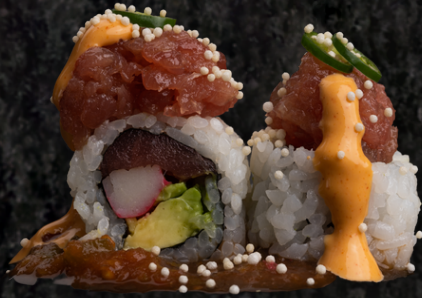
Mars Roll 마스 롤