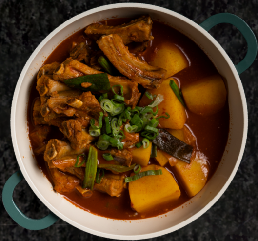
Korean Spicy Pork Ribs 매운 등갈비찜