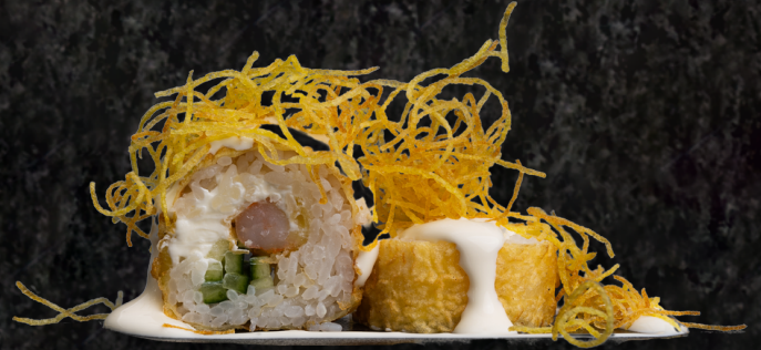
Gold Roll 골드 롤