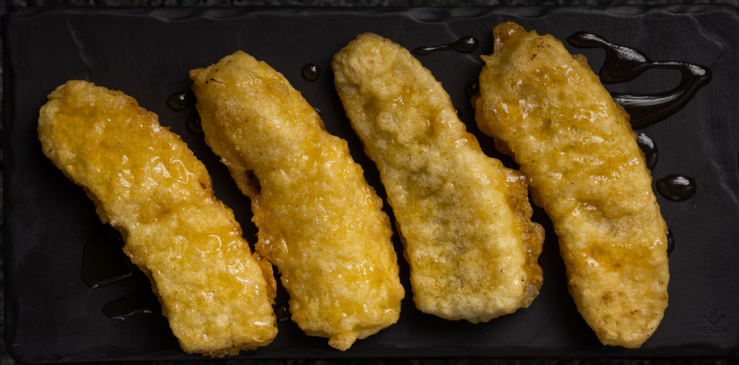
Fried Banana 튀긴 바나나