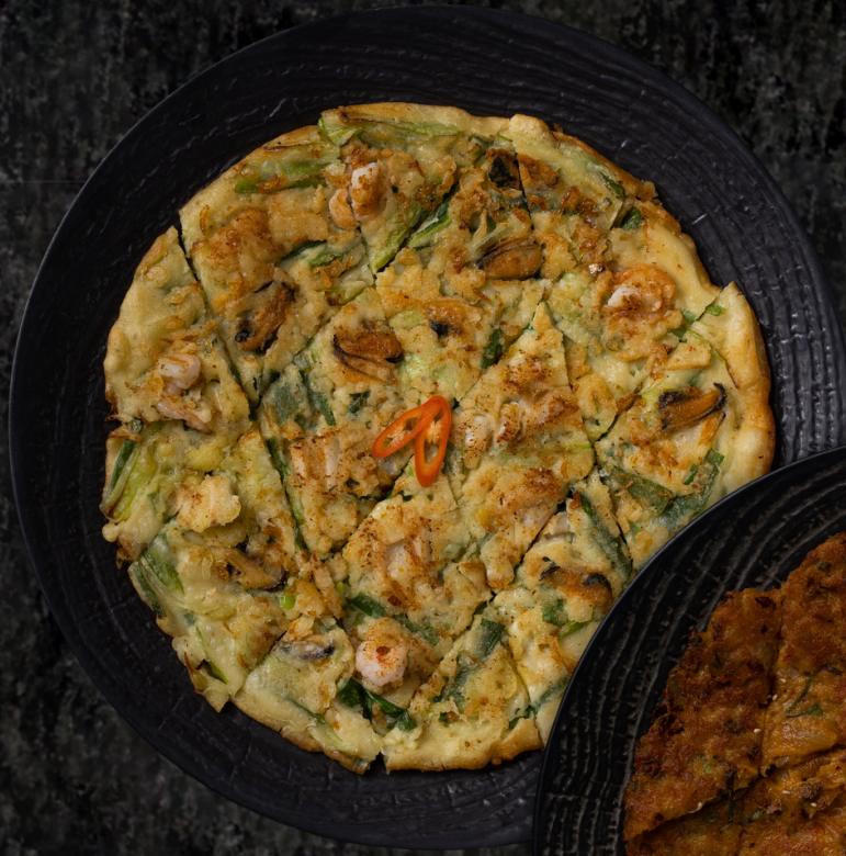
Seafood Pa-jeon 해물 파전