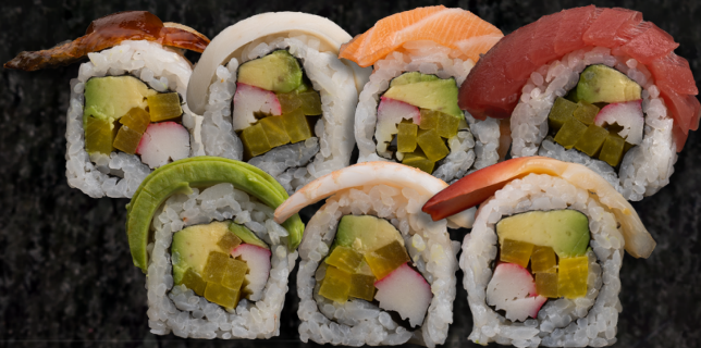
Rainbow Roll 레인보우 롤