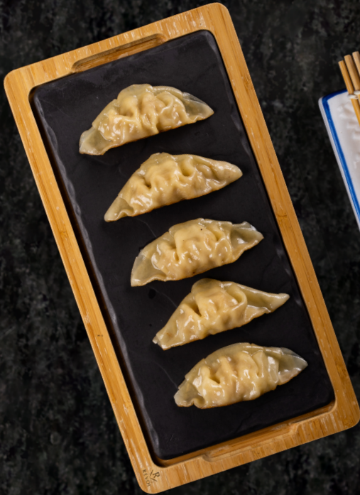
Yaki Gyoza 야끼교자