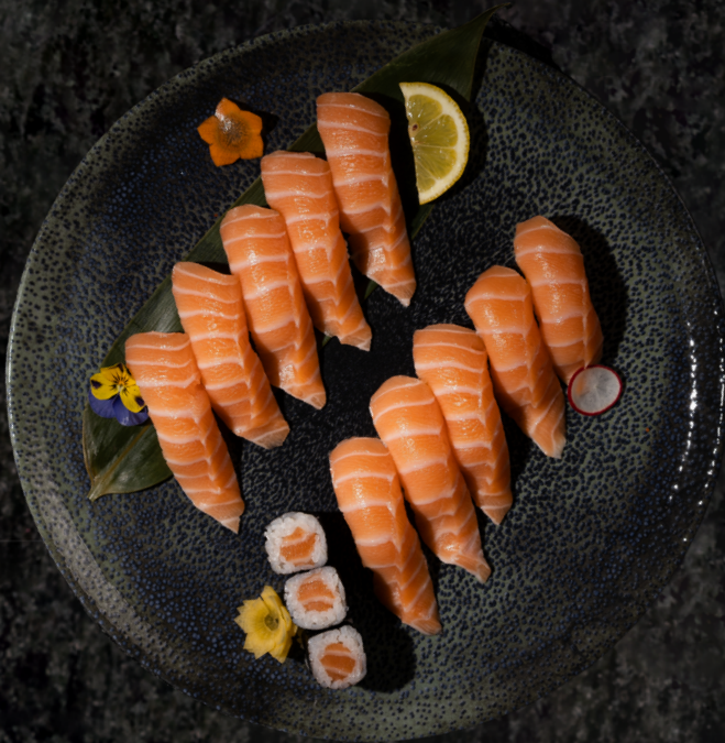
Sake Sushi 연어 초밥 세트