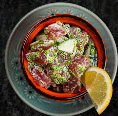
Tuna Salad 참치 샐러드