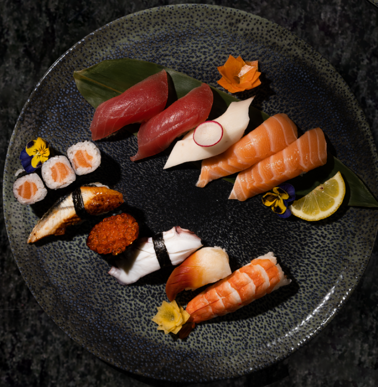
Mix Sushi Set 스시 세트