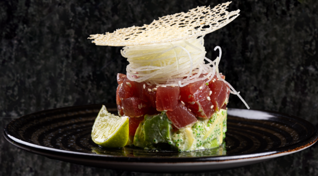
Salmon Tartar 연어 타르타르