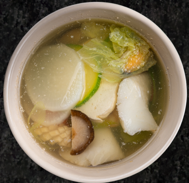
Suimono 맑은 생선국