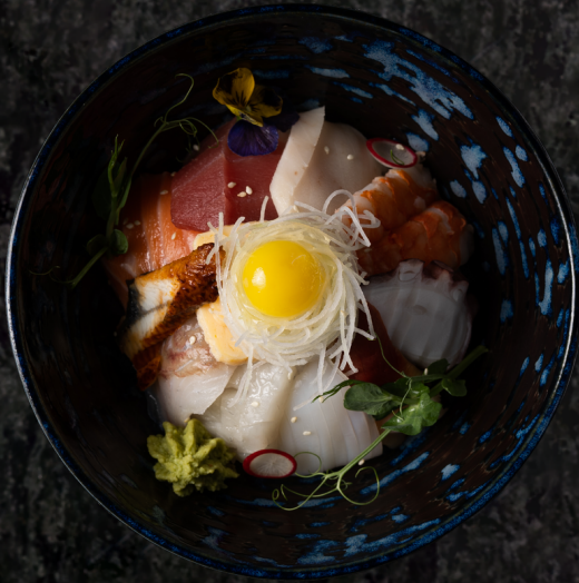
Chirashi Bowl 지라시덮밥