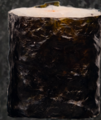
Ebi Maki 새우