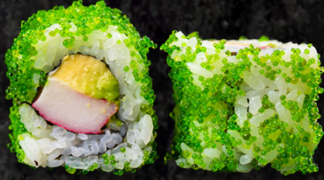
Cali Wasabikko Roll 캘리포니아 와사비코 롤