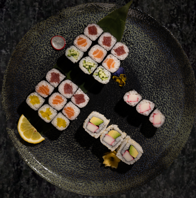
Maki Set 마끼 세트