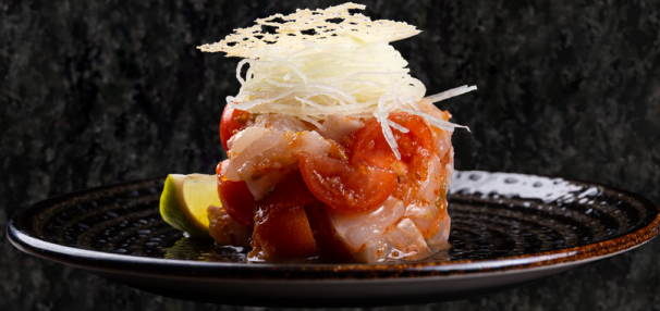
Salsa Fish-tomato 살사 생선포마토