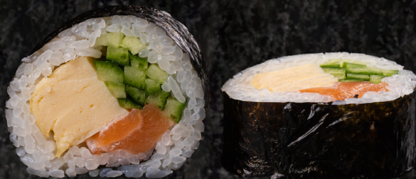
Salmon-Tamago-Kappa Maki 연어+계란+오이 마끼