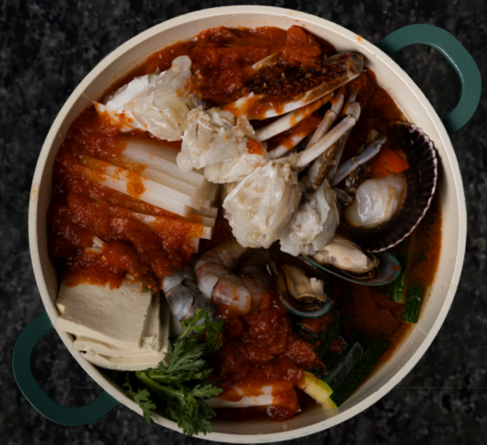
Crab Haemultang 꽃게 해물탕