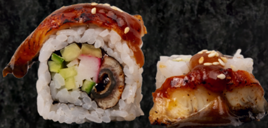
Dragon Roll 드래곤 롤