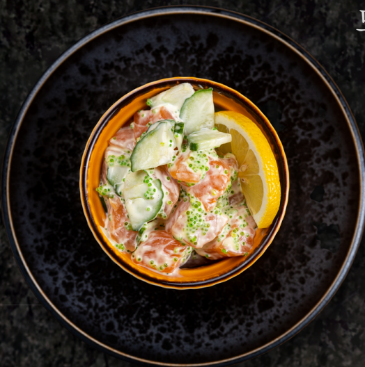
Sake Salad 연어 샐러드