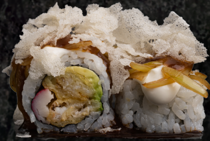
Mercury Roll 머큐리 롤