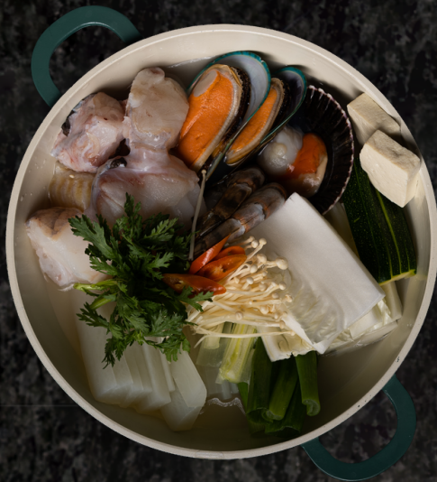
Anglerfish Soup 아구 지리