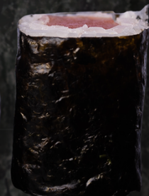
Tekka Maki 참치