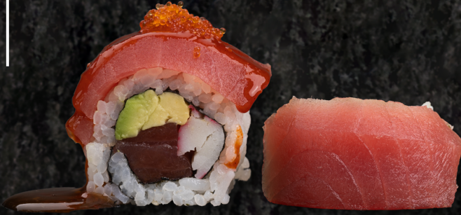
Ruby Roll 루비 롤