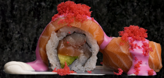
Pink Roll 핑크 롤