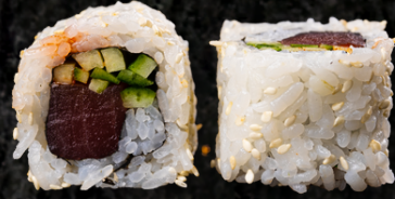
Spicy Tuna Roll 매운 참치 롤