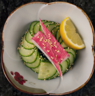
Wakame Salad 미역 초무침