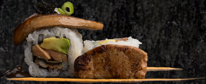
Foie-gras Unagi Roll 푸아그라-장어 롤