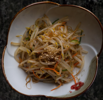
Moyashi Salad 숙주 무침