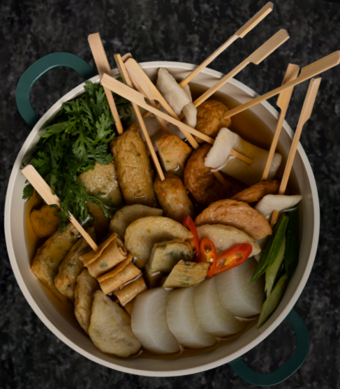
Eomuk Jeongol 어묵 전골