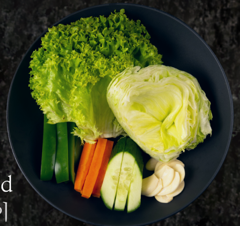
Sangchu Salad 상추샐러드, 파절이