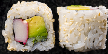
California Roll 캘리포니아 롤