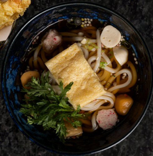
Tempura Udon 우동