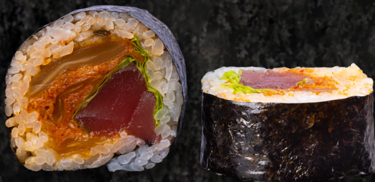
Kimchi-Tuna Maki 김치+참치 마끼