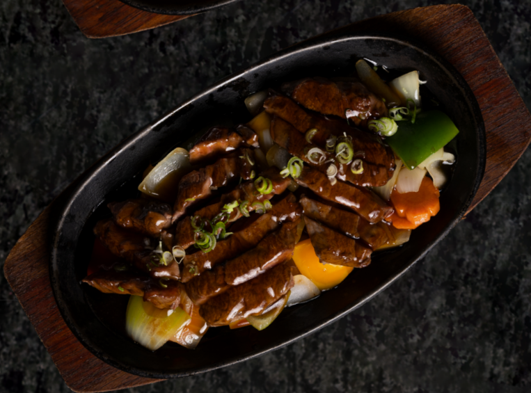
Beef Teriyaki 소고기 데리야끼