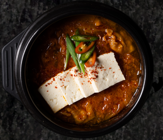
Kimchi Jjigae 김치찌개