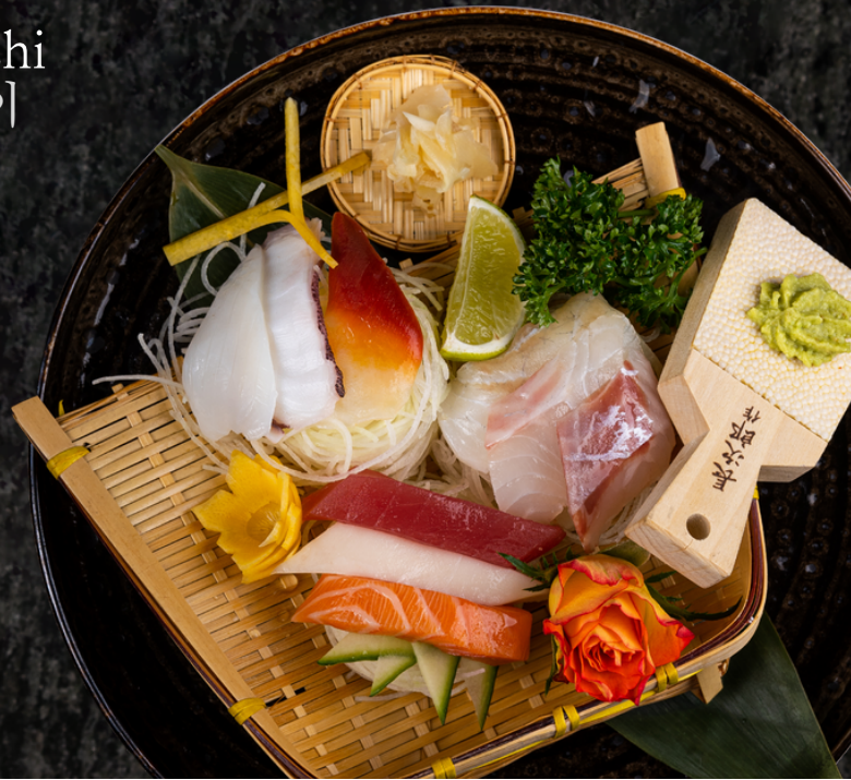
Sampler Sashimi 샘플러 사시미