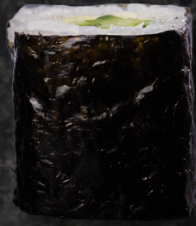
Kappa Maki 오이