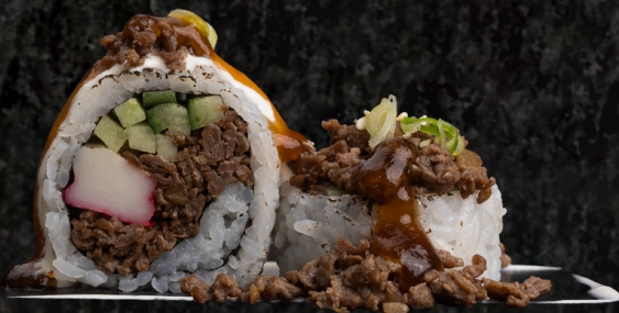
Bulgogi Roll 불고기 롤