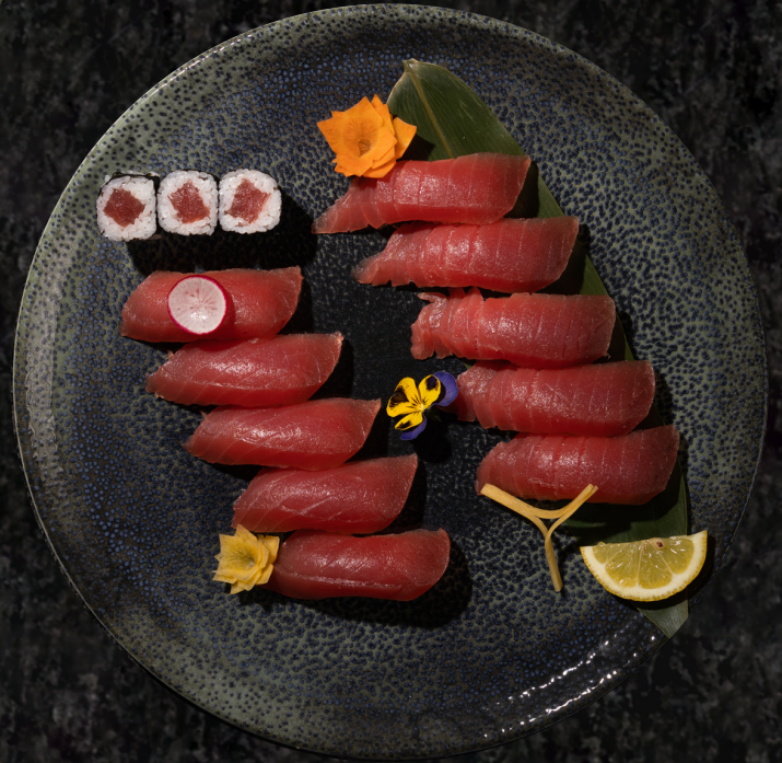
Maguro Sushi 참치 초밥 세트