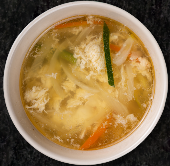
Egg Soup 계란탕