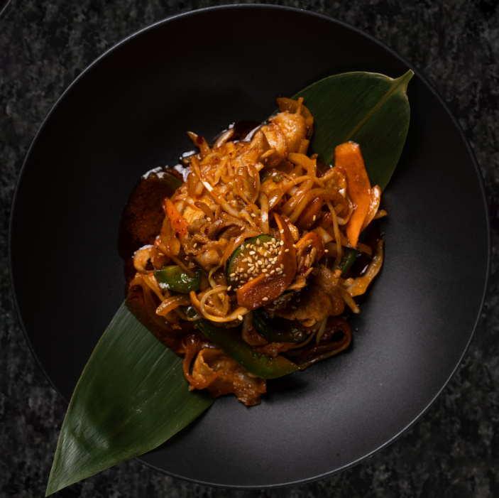
Jeyuk Bokkeum 제육 볶음