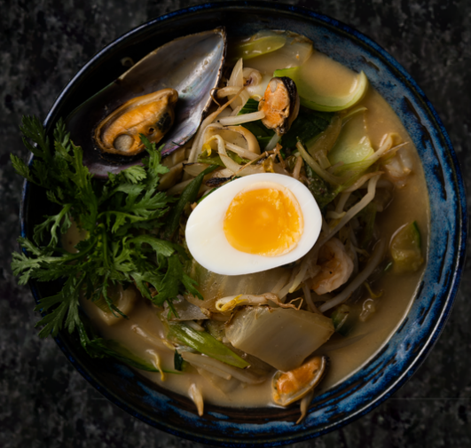
Nagasaki Jjampong 나가사키 짬뽕