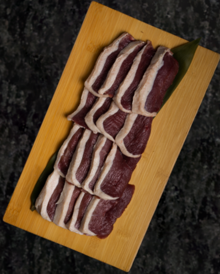
Ori-roast 오리 구이